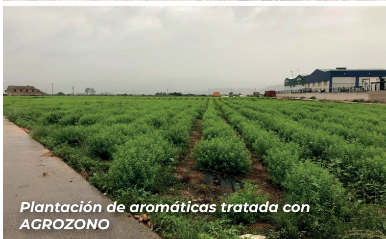
Plantación de aromáticas tratada con AGROZONO