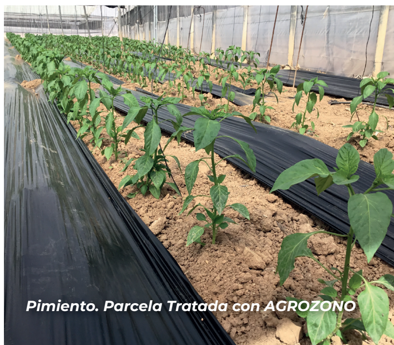
Pimiento. Parcela Tratada con AGROZONO