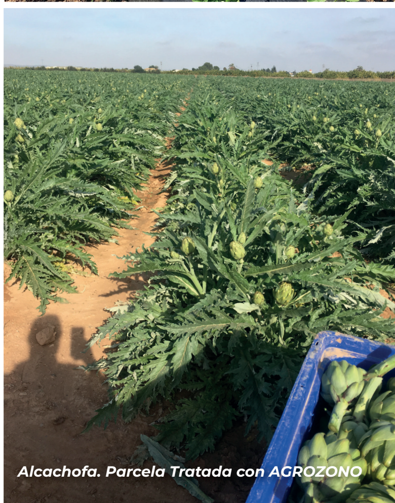
Alcachofa. Parcela Tratada con AGROZONO