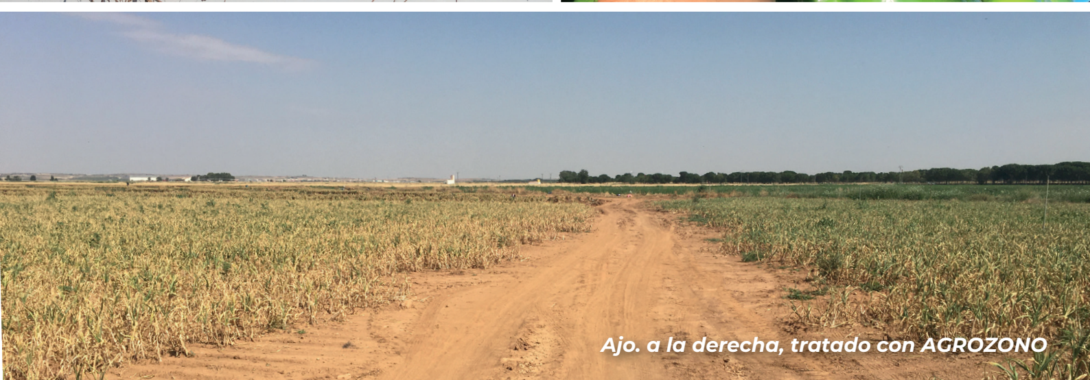
Ajo. a la derecha, tratado con AGROZONO