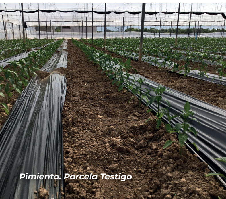
Pimiento. Parcela Testigo