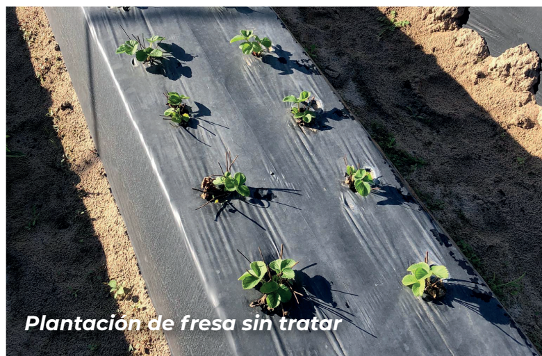
Plantación de fresa sin tratar