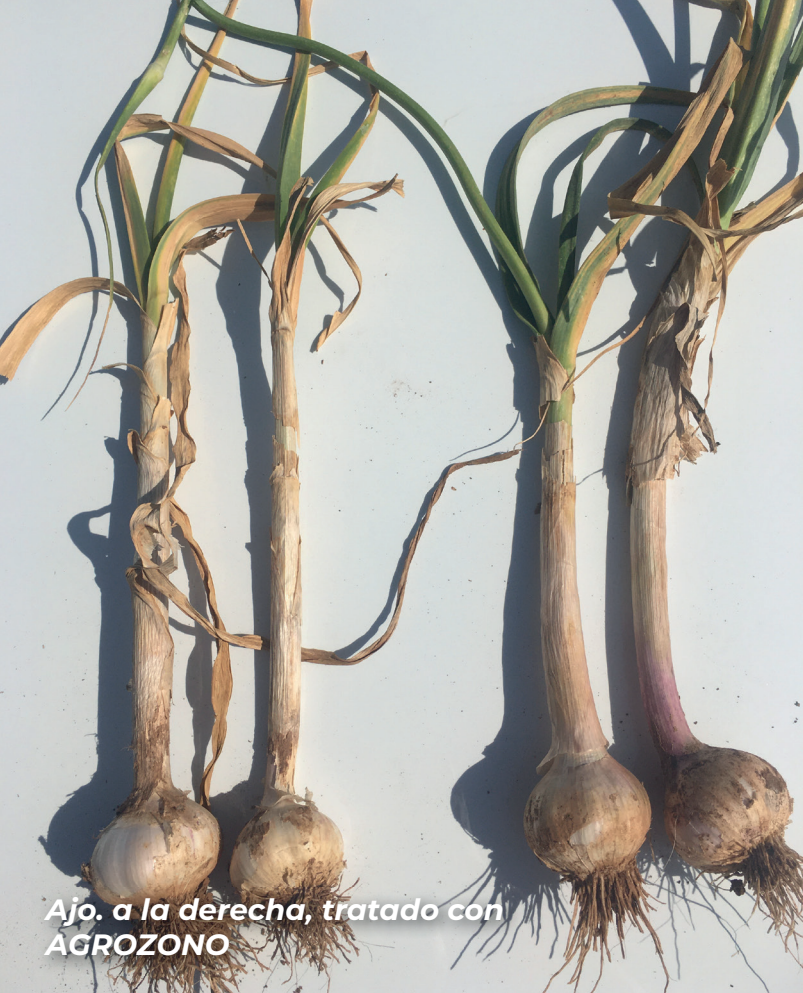
Ajo. a la derecha, tratado con AGROZONO