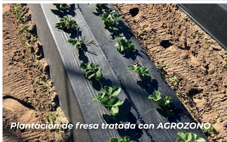
Plantación de fresa tratada con AGROZONO