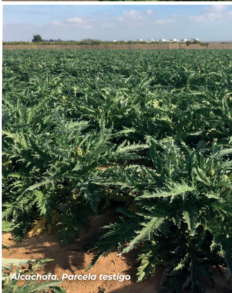
Alcachofa. Parcela testigo