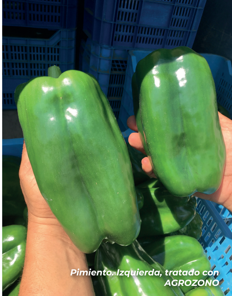
Pimiento. Izquierda, tratado con AGROZONO