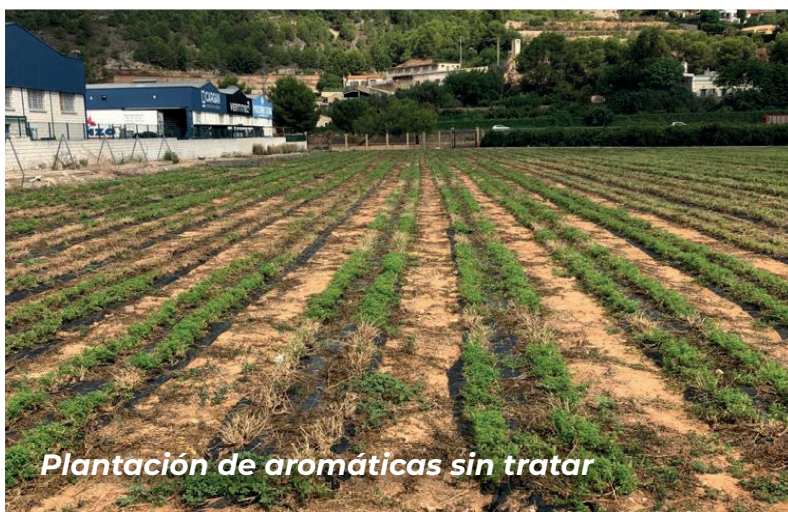
Plantación de aromáticas sin tratar